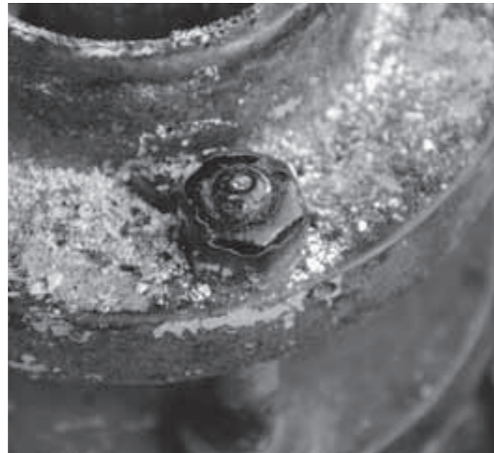
Verwitterung und Farbschichten machen das Lösen von Schrauben zu einer heiklen Angelegenheit.