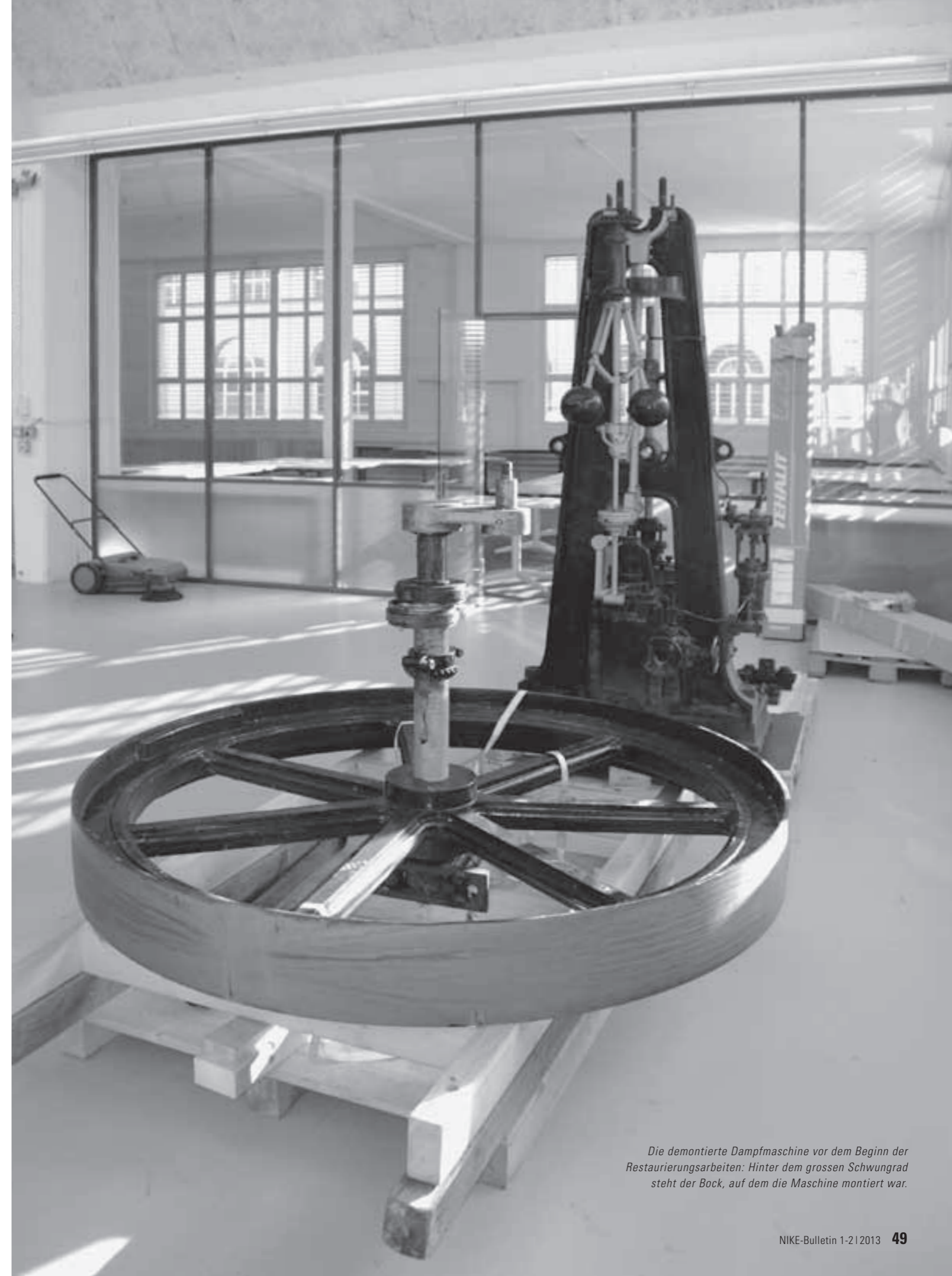
Die demontierte Dampfmaschine vor dem Beginn der Restaurierungsarbeiten: Hinter dem grossen Schwungrad steht der Bock, auf dem die Maschine montiert war.

dicken Farbschichten schauen kann, ist es für einen Restaurator zunächst schwierig, Prognosen zu stellen, was wieder belebt werden kann. Dabei sind solch dicke Farbschichten bei historisch-technischen Kulturgütern auch hilfreich, da sie bei der Freibewitterung als Schutzschicht dienen. Im Fall der Bally-Dampfmaschine konnte die Grundierung als Ölbleimennige bestimmt werden. Schlecht für die Umwelt, doch gut für den Restaurator: Blei ist das einzige Pigment, welches eine metallorganische, feste Verbindung mit Restrost auf dem Gussobjekt eingeht. Das bedeutet, dass die Stabilität zumindest bis zu den festsitzenden Rostschichten ausreichend vorhanden ist. Dort allerdings, wo sich am späteren Freiluftstandort durch nachlässige Reinigung respektive mangelnden Unterhalt Erdkompressen bildeten und die Materialquerschnitte schwach waren, fand sich ein Bild der Zerstörung. Auf Flächen, wo das Regenwasser liegenblieb, und in Spalten, wo es eindringen konnte, türmte sich Rost.